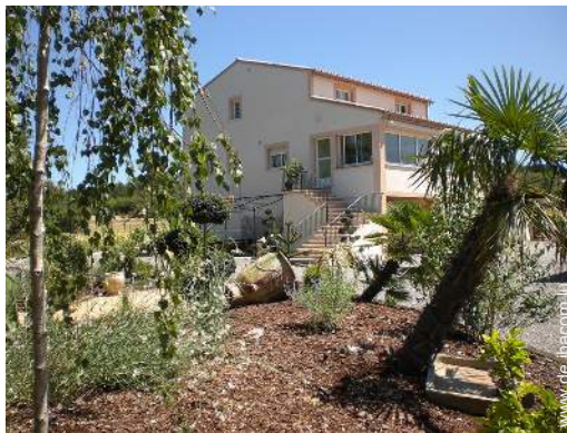
Villa mit Charme