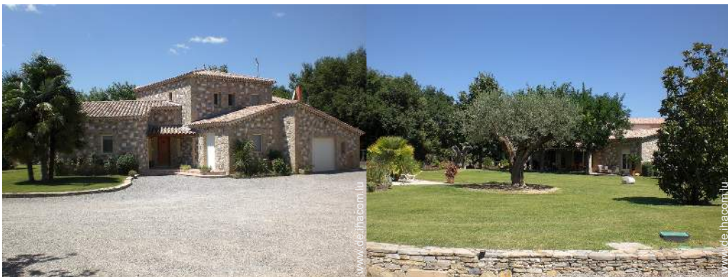
Villa mit Charme