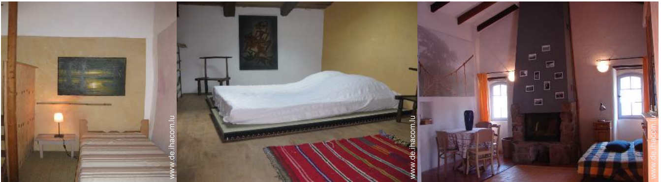
Futon(s) 2 Personen