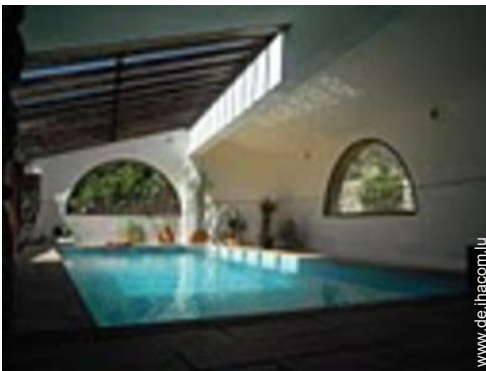
Swimmingpool im Haus