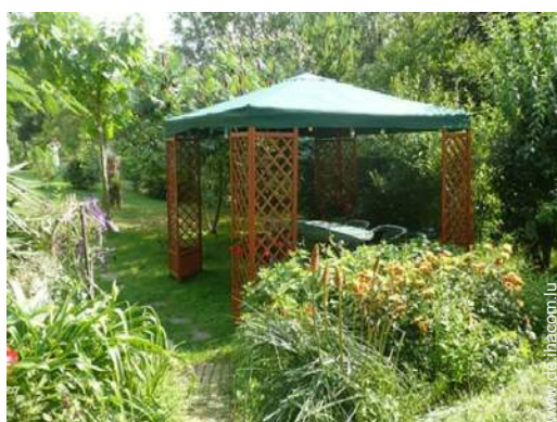
Außenausstattung zur Verfügung der Gäste