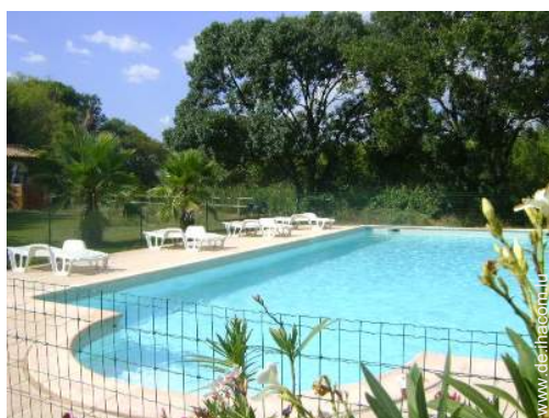
Swimmingpool in Wohnanlage