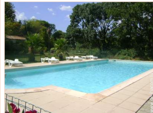
Swimmingpool in Wohnanlage