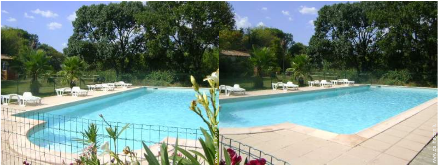
Swimmingpool in Wohnanlage