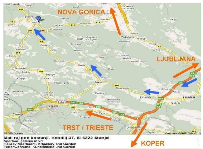
Mali raj pod kostanji, Kobjilj 37, SI-6222 Stanjel Holiday Apartment, Artgallery and Garden Ferienwohnung, Kunstgalerie und Garten