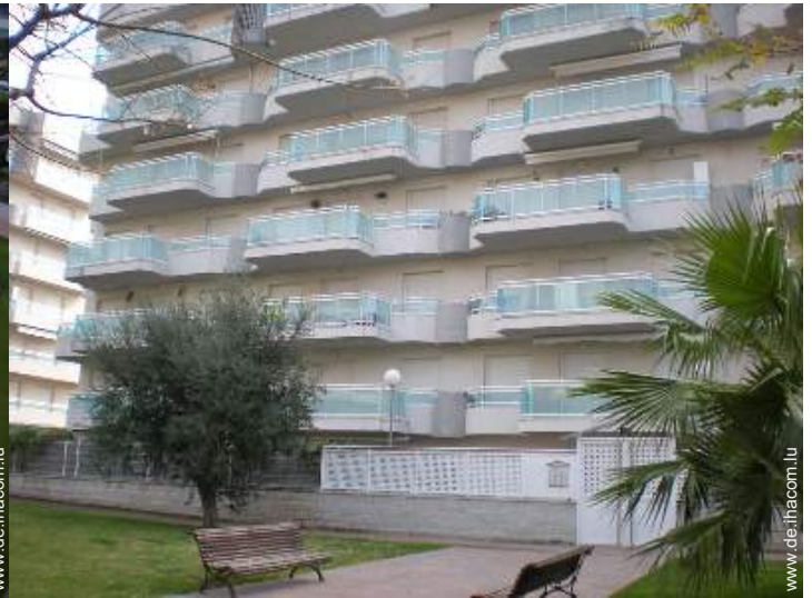
Blick auf Straße/Avenue