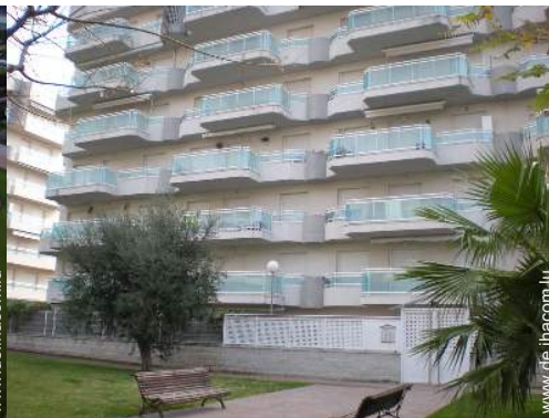
Blick auf Straße/Avenue