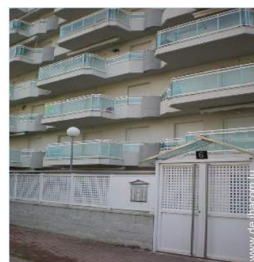
Blick auf Straße/Avenue