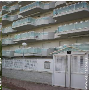
Blick auf Straße/Avenue