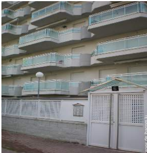
Blick auf Straße/Avenue