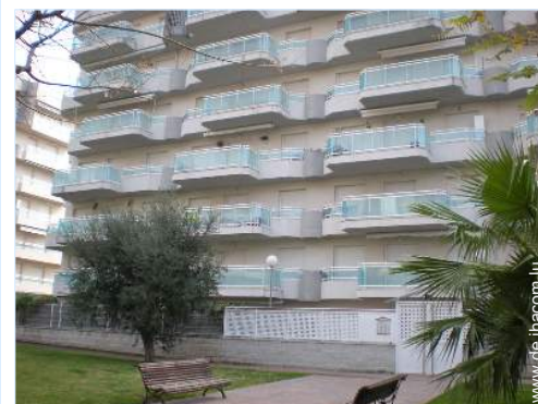
Blick auf Straße/Avenue