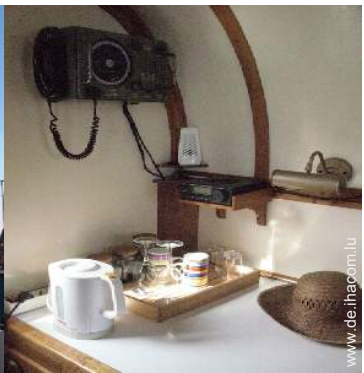
Innenkomfort zur Verfügung der Gäste