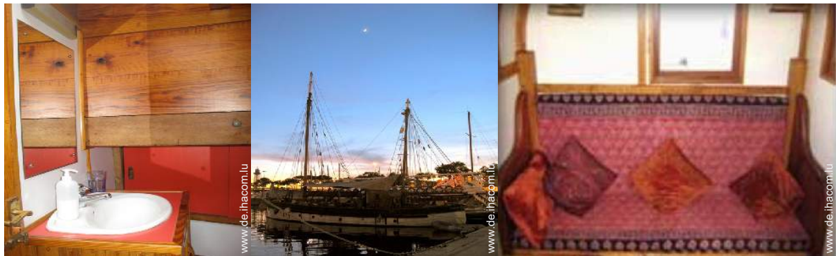
Raumaufteilung zur Verfügung der Gäste