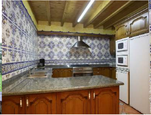
große amerikanische Küche