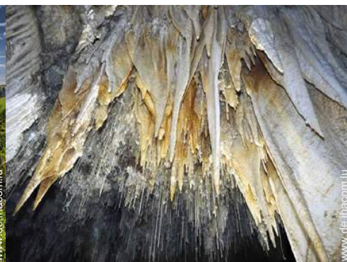
Flugsport in der Nähe