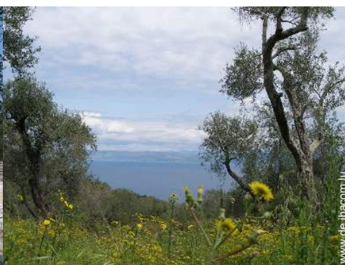
Blick aufs Land