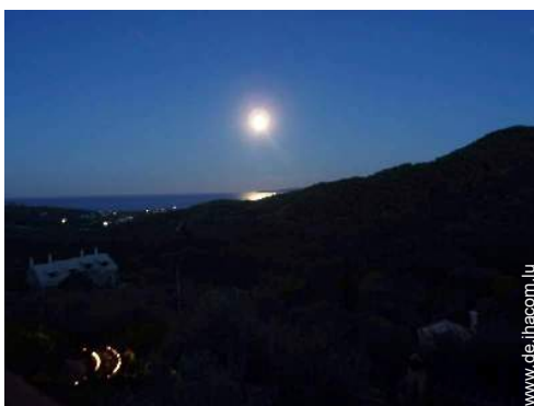
Blick auf Ozean