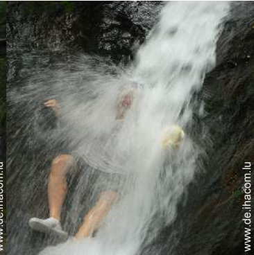
Gebirgsaktivitäten in der Nähe