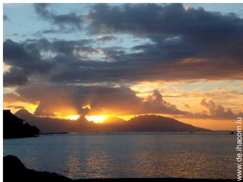
Blick auf Sonnenuntergang