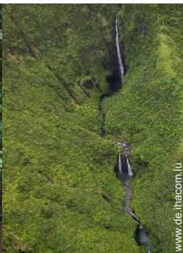
Flugsport in der Nähe