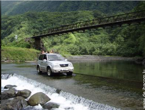
Gebirgsaktivitäten in der Nähe