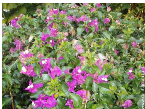
Äußerer Rahmen zur Verfügung der Gäste