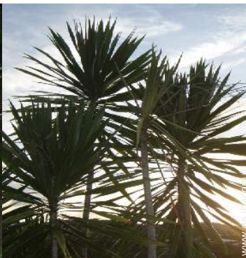
Blick auf Sonnenuntergang