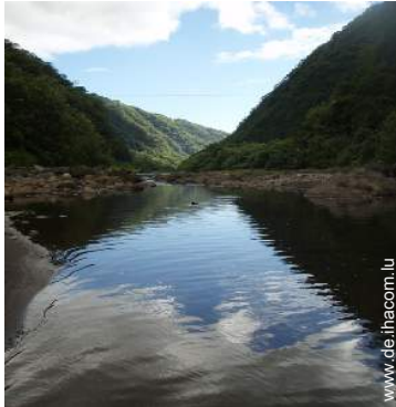
Gebirgsaktivitäten in der Nähe