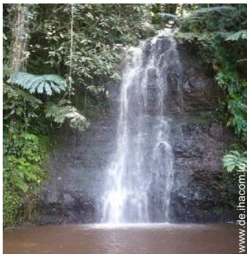
Gebirgsaktivitäten in der Nähe