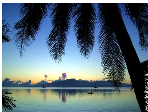
Blick auf Ozean