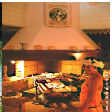
Table d'Hôte (Gemeinschaftstafel)