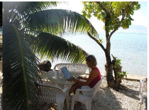
Wi-Fi (drahtloser Internetzugang)