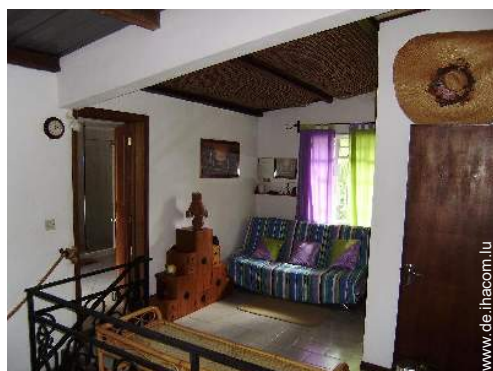
Sofabett(en) 1 Person