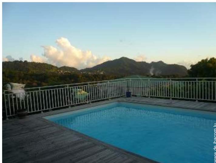
Blick auf Gebirge