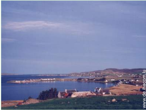
Blick auf Dorf