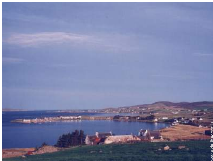
Blick auf Dorf