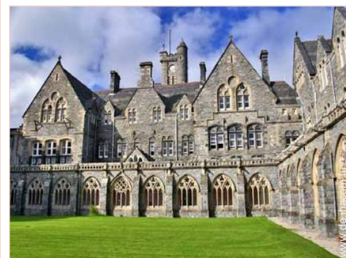
Blick auf Hof