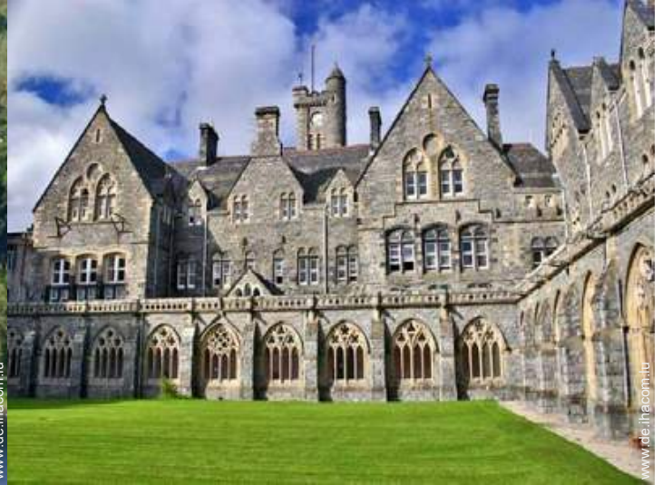
Blick auf Hof