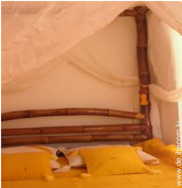
Anwesen mit Charme