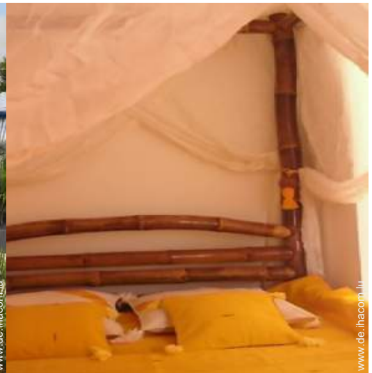
Anwesen mit Charme