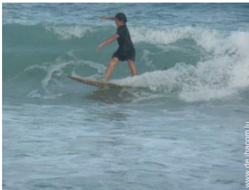
Wassersport in der Nähe