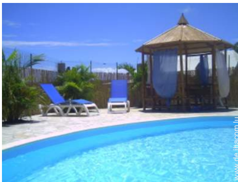
Wi-Fi (drahtloser Internetzugang)