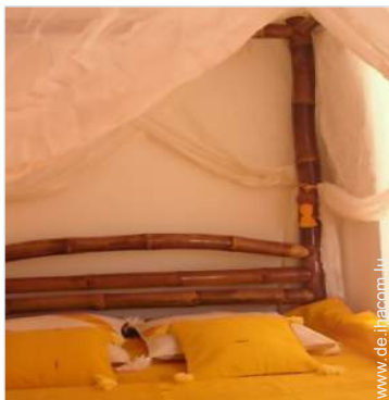
Anwesen mit Charme

Besondere Vorzüge : Direkter Zugang zum Strand