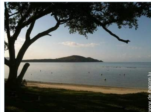
direkter Zugang zum Strand