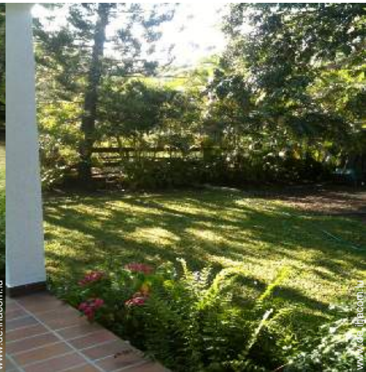
Blick auf Garten/Park