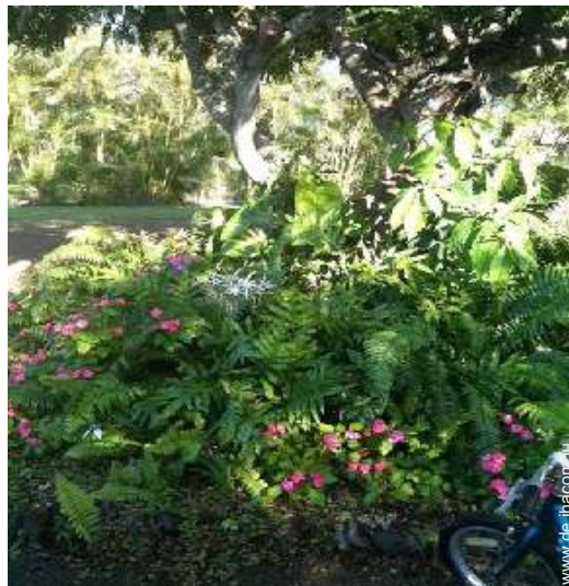
Blick auf Garten/Park