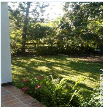
Blick auf Garten/Park

Besondere Vorzüge : Direkter Zugang zum Strand, Privatstrand