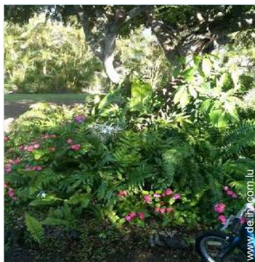
Blick auf Garten/Park