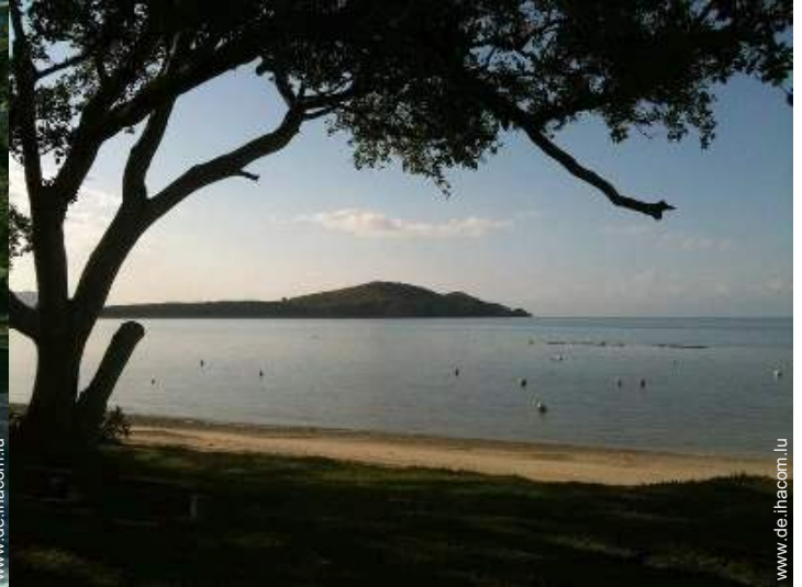
direkter Zugang zum Strand