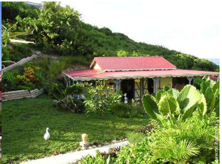
Holzhaus mit Charme