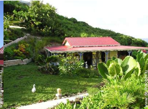
Holzhaus mit Charme