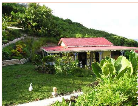
Holzhaus mit Charme