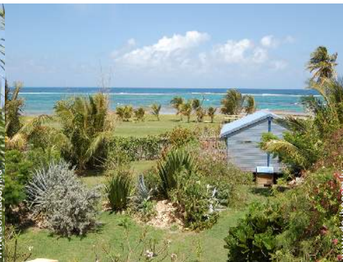
Bungalow mit Charme