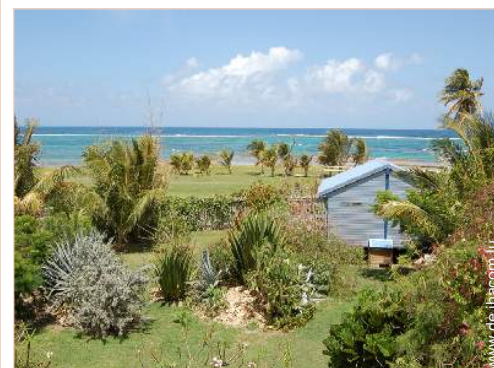
Bungalow mit Charme