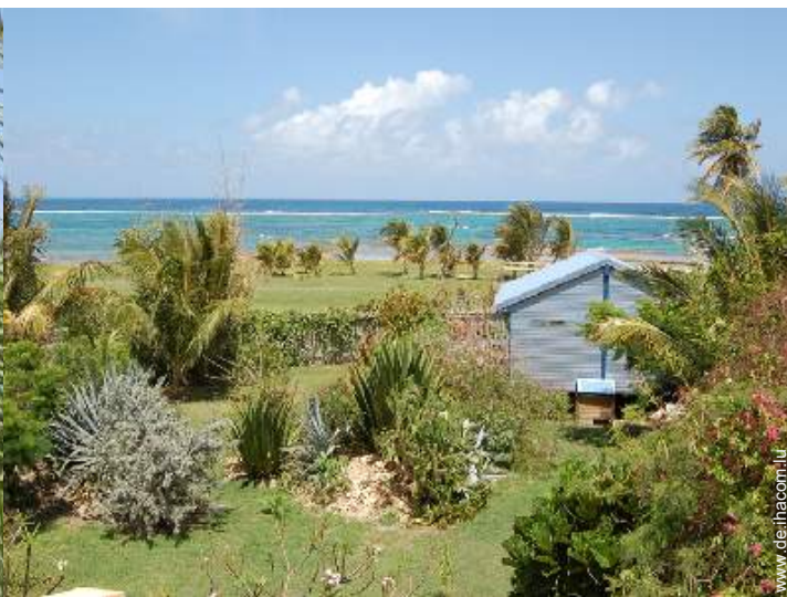
Bungalow mit Charme