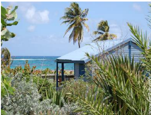
Bungalow mit Charme