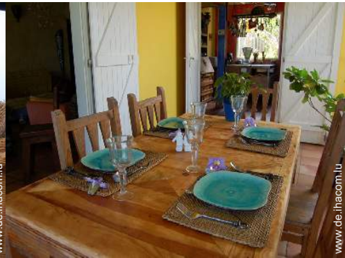
Table d'Hôte (Gemeinschaftstafel)