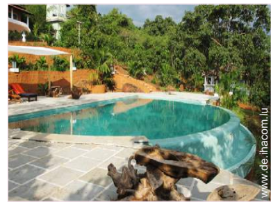
Äußerer Rahmen zur Verfügung der Gäste