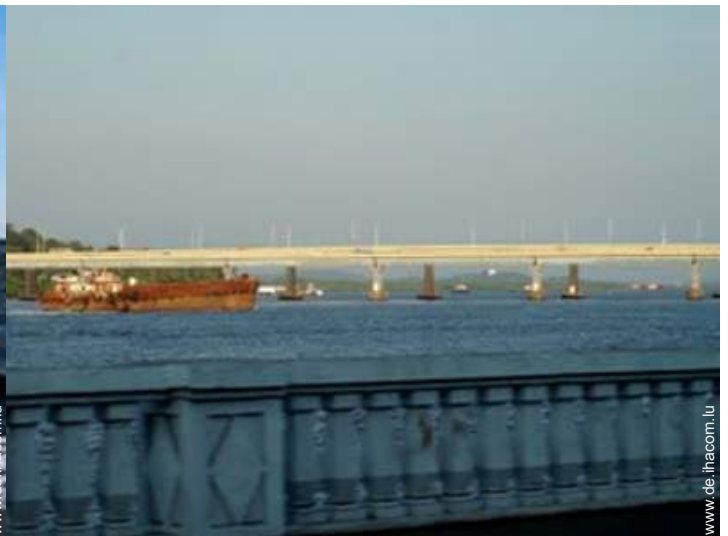
Blick auf Fluss