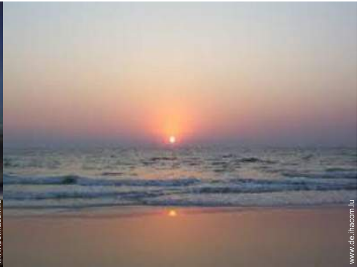
Blick auf Fußgängerzone