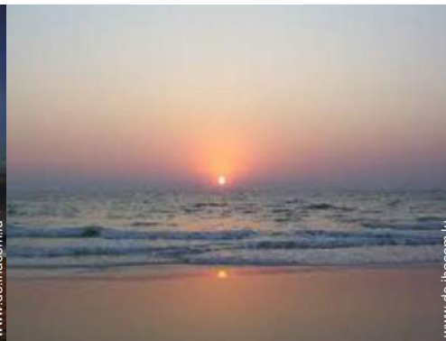
Blick auf Fußgängerzone