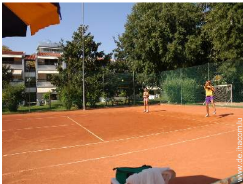
Tennis - Erde