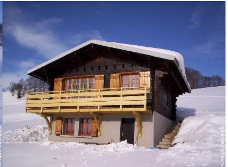
Winteraktivitäten in der Nähe