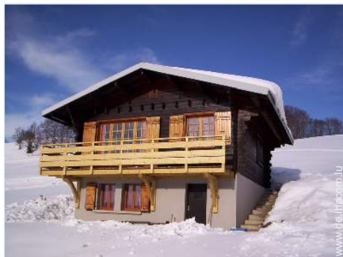
Winteraktivitäten in der Nähe