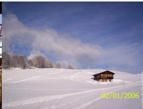
Gebirgsaktivitäten in der Nähe