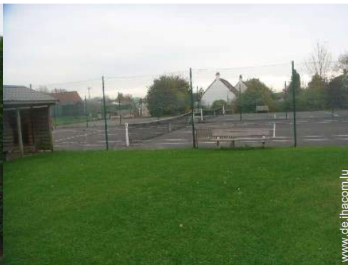
Tennisplatz - harter Belag