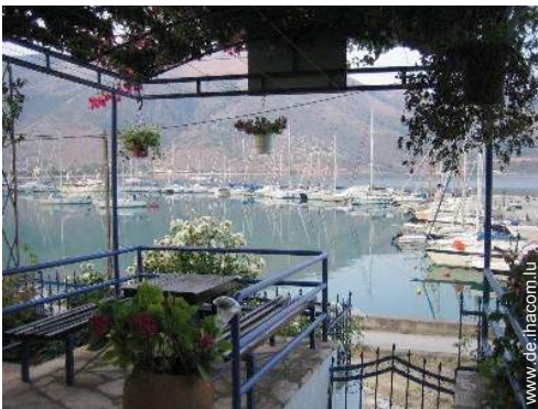
Blick auf Hafen