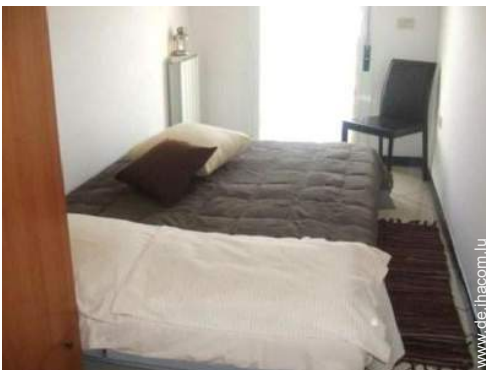
Sofabett(en) 2 Personen