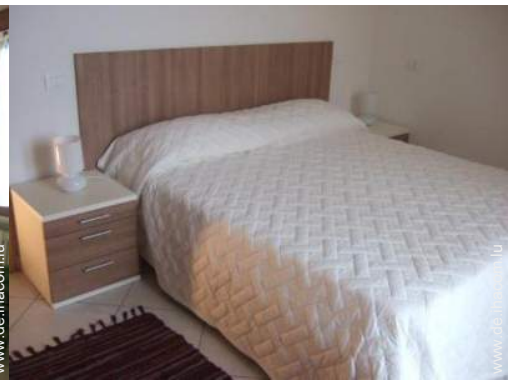
Sofabett(en) 2 Personen