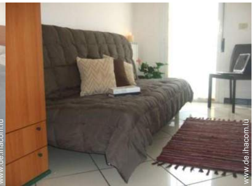
Sofabett(en) 2 Personen