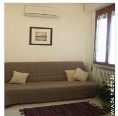
Sofabett(en) 2 Personen