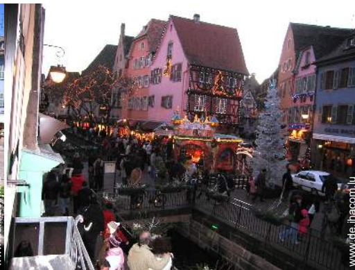
Blick auf Platz