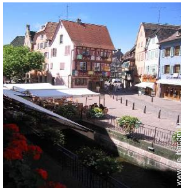
Blick auf Fußgängerzone