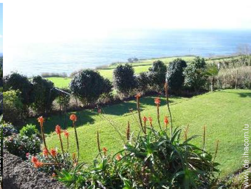
Blick auf Felder