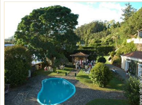
Swimmingpool in Wohnanlage