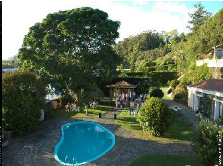
Swimmingpool in Wohnanlage