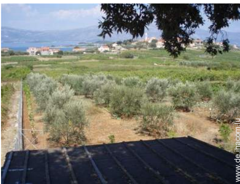
Blick auf Weinberge