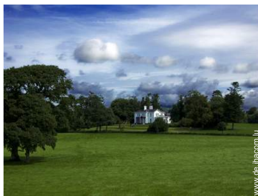
Blick auf Wiese