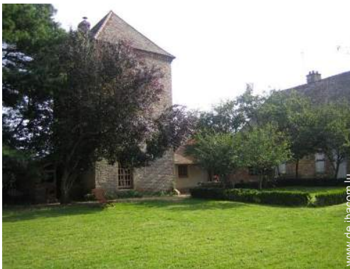
Haus mit Charme