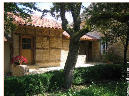
Haus mit Charme