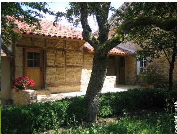
Haus mit Charme