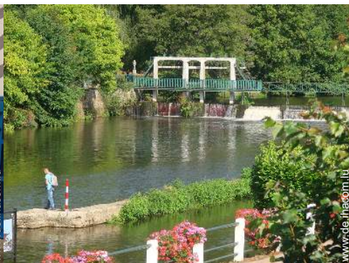
Blick auf Fluss