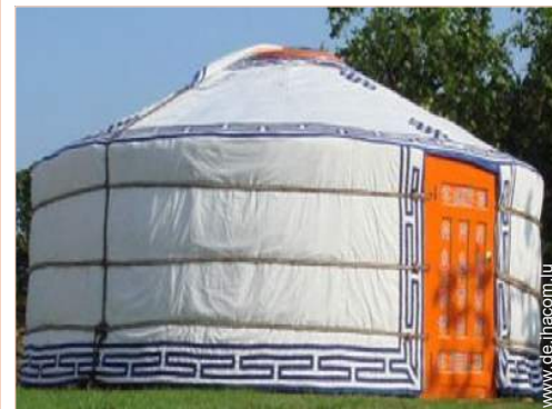
Jurte mit Charme (mongolisches Zelt)