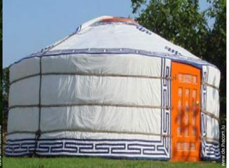
Jurte mit Charme (mongolisches Zelt)