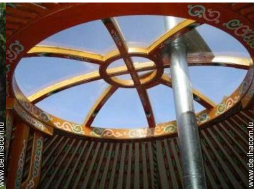
Jurte mit Charme (mongolisches Zelt)