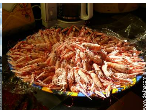
Attraktionen und Entspannung