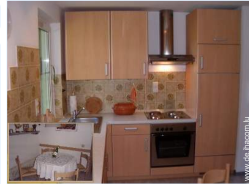
große separate Küche