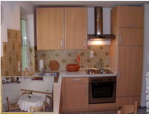
große separate Küche