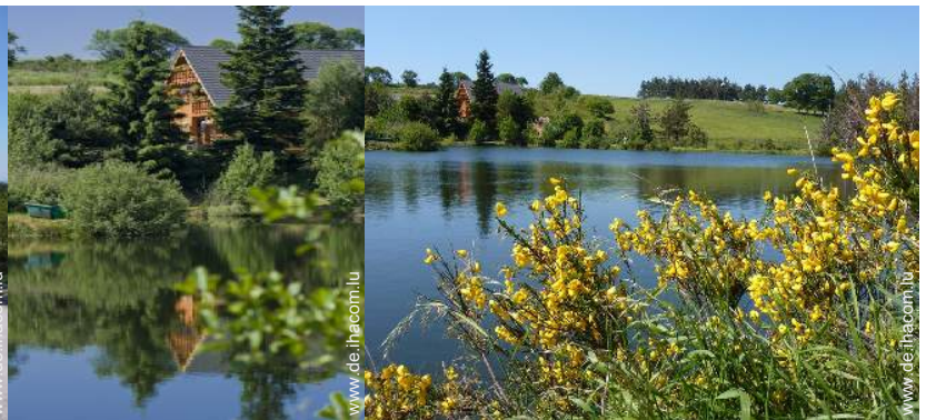
Blick auf See