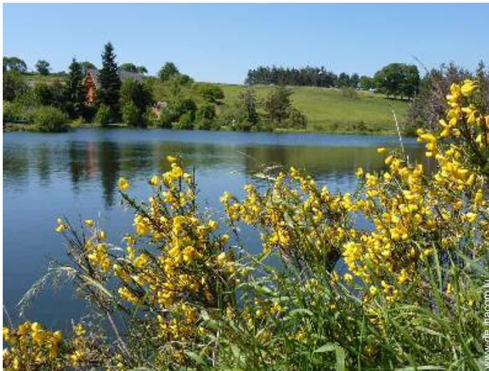
Blick auf See