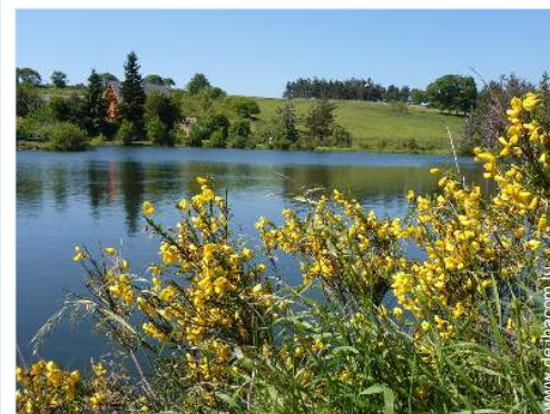
Blick auf See

- Dorfzentrum 2km - Bäckerei 2km - Ortliche Geschäfte 2km - Supermarkt 4km - Apotheke 2km