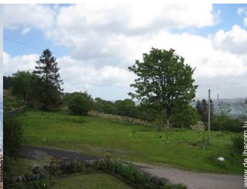
Blick auf Felder