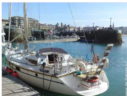
Blick auf Hafen