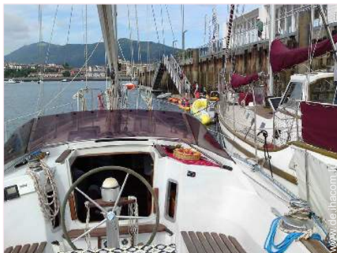
Außenanlage zur Verfügung der Gäste

Besondere Vorzüge : Ankerplatz, Hafentiegeplatz