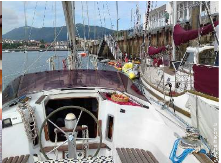
Außenanlage zur Verfügung der Gäste