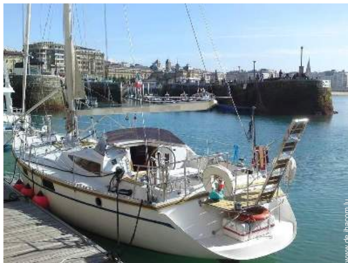
Blick auf Hafen