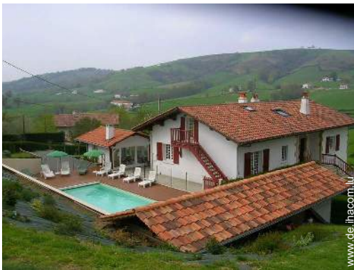
Blick auf Felder