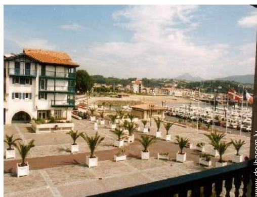
Blick auf Gebirge