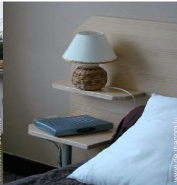
Wi-Fi (drahtloser Internetzugang)