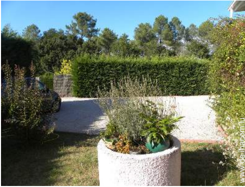
Blick auf Wald