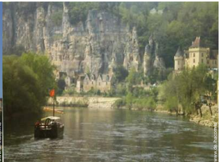
Blick auf Fluss