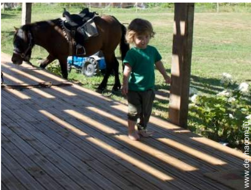
Pferde und Reitausrüstung