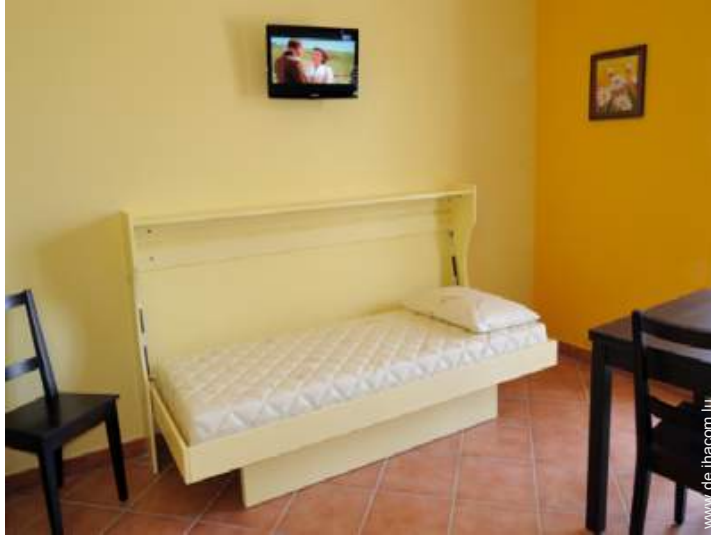
Schrankbett(en) 1 Person