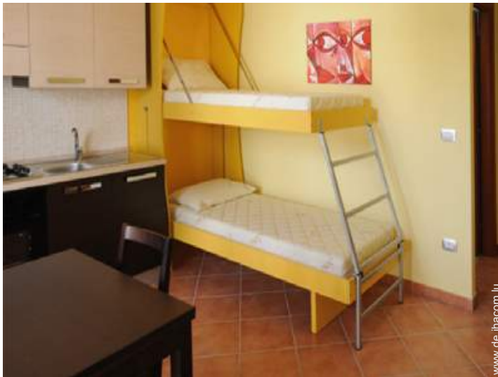
Schrankbett(en) 2 Personen