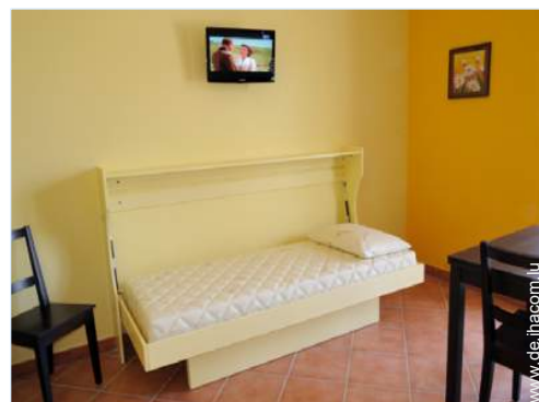
Schrankbett(en) 1 Person