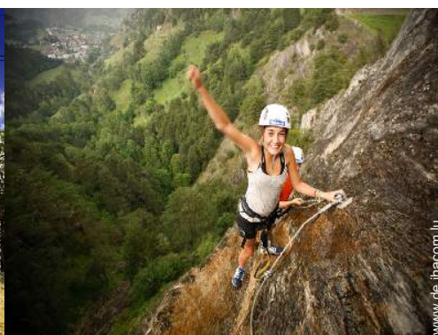
Via ferrata (Klettersteig)