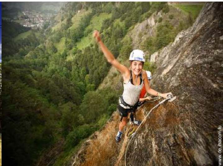
Via ferrata (Klettersteig)